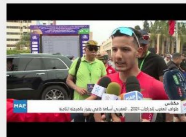
مخاض طواف المغرب للدراب 2024. المغرب أمامه ثاني أفضل بفرصته لثامنة