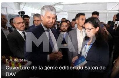
7 JUIN 2024 Ouverture de la 3ème édition du Salon de l'IAV