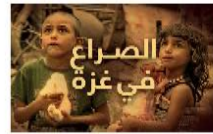
الصراع في غزة