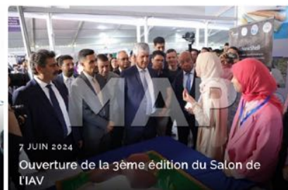
7 JUIN 2024 Ouverture de la 3ème édition du Salon de l'IAV