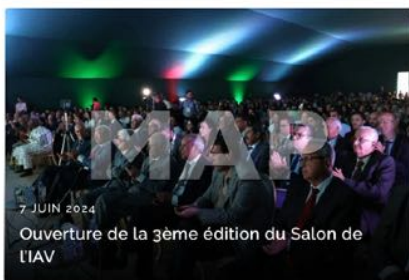
7 JUIN 2024 Ouverture de la 3ème édition du Salon de l'IAV