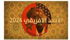
الأسد الإفريقي 2024