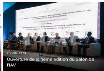
7 JUIN 2024 Ouverture de la 3ème édition du Salon de l'IAV