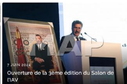
7 JUIN 2024 Ouverture de la 3ème édition du Salon de l'IAV