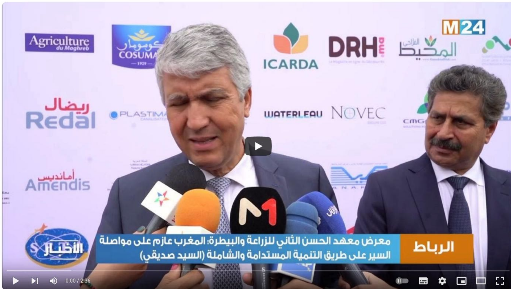
معرض معهد الحسن الثاني للزراعة والبيطرة: المغرب عازم على مواصلة السير على طريق التنمية المستدامة والشاملة (السيد صديقي) الرباط

المغرب عازم على مواصلة السير على طريق التنمية المستدامة والشاملة (السيد صديقي)