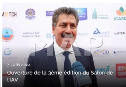
7 JUIN 2024 Ouverture de la 3ème édition du Salon de l'IAV