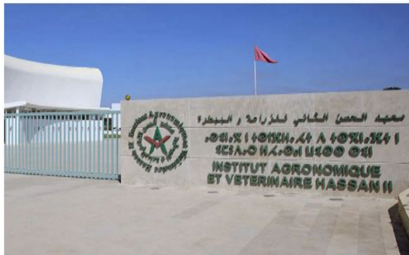
معهد الحسن الثاني للزراعة والبيطرة في الرباط